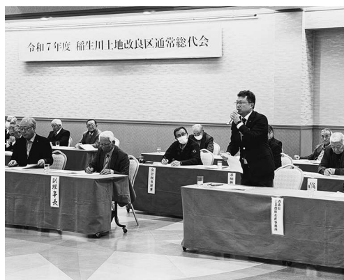
上北農林水産事務所 竹谷次長

結びに、稲生川土地改良区の益々の御発展と御参会の皆様の御健勝を祈念申し上げ、挨拶といたします。